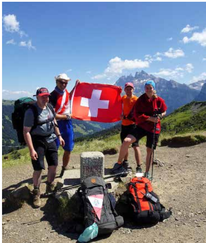
Grenzübertritt Frankreich - Schweiz auf Etappe 5.

Das Organisations-Team wurde schnell von 2 auf 6 Mitarbeiter vergrößert und die ersten konkreten Schritte gesetzt. Auf der einen Seite war es notwendig, aus den vielen Interessenten Teilnehmer zu machen, auf die wir uns verlassen konnten. Auf der anderen Seite galt es, die konkrete Route auszuarbeiten und später den Teilnehmern aufgrund ihrer Verfügbarkeit und Vorlieben, ihre Etappen zuzuweisen. Am Ende waren wir dann doch verwundert, wie reibungslos sich die Staffel fast wie von selbst aufstellte. Zeitgleich machten wir uns