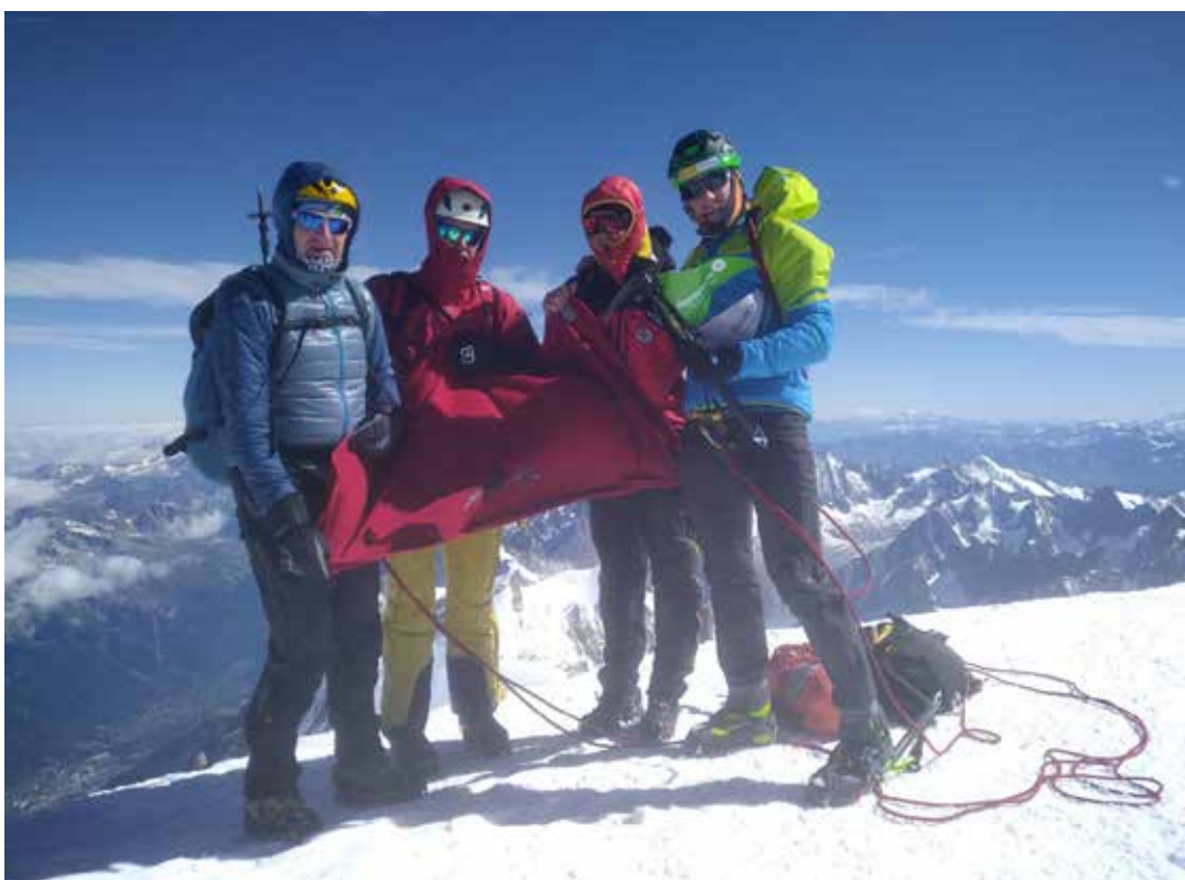
Das Team am Gipfel des Mont Blanc.

Wer jetzt Lust bekommen hat, die ALPEN-TOUR zu verfolgen, kann das im Internet unter www.alpen-tour-2021.at sowie auf Facebook unter alpen-tour2021 und Instagram unter alpen_tour2021 . ■