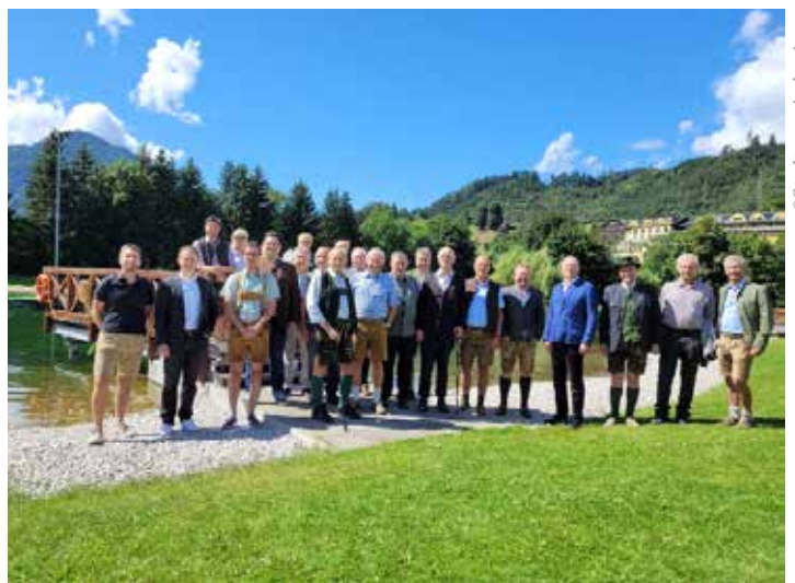
Visionäre, Wegbegleiter und die Verantwortlichen von heute feierten das runde Jubiläum

Der Badesee Pichl ist eine der wichtigsten touristischen Infrastruktureinrichtungen in