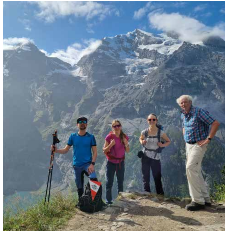
Im Wallis auf der 12. Etappe.

Dass sich das Wetter in 50 Tagen nicht immer von seiner besten Seite zeigen würde, war uns natürlich von Anfang an klar. Nach 9 Tagen Sonnenschein folgte am zehnten Tag die erste Regenettepe. Das Team zeigte sich aber unbeeindruckt und legte auch diese Etappe auf der Originalroute zurück. In der Planung wurde zwar für jeden Tag auch eine Schlechtwettervariante geplant, um den Fortschritt gewährleisten zu können, bisher musste aber keine Gruppe auf diese Alternative zurückgreifen. Am nächsten Tag war das Wetter auch schon wieder besser. Zwar stellenweise recht neblig, aber zumindest trocken führte die Route über Adelboden nach Kandersteg.