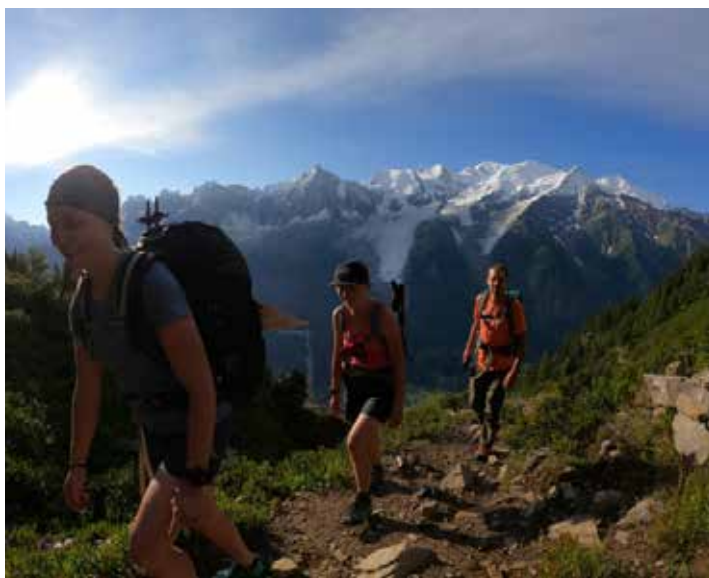
Anstieg zum Refuge Moëde Anterne auf der 2. Etappe.

Bei besten Wetterbedingungen wurden die ersten Etappen zurückgelegt. Und das nicht nur zu Fuß, auch der Paraglider kam bei einem Hüttenüberflug des Refuge Moëde Anterne zum Einsatz.