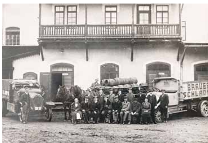
Historisches Foto 1929 zur 20-Jahr-Feier der Brauerei. Trotz Wirtschaftskrise hatte man neben den Pferdefuhrwerken zwei LKWs zum Ausliefern des Bieres.