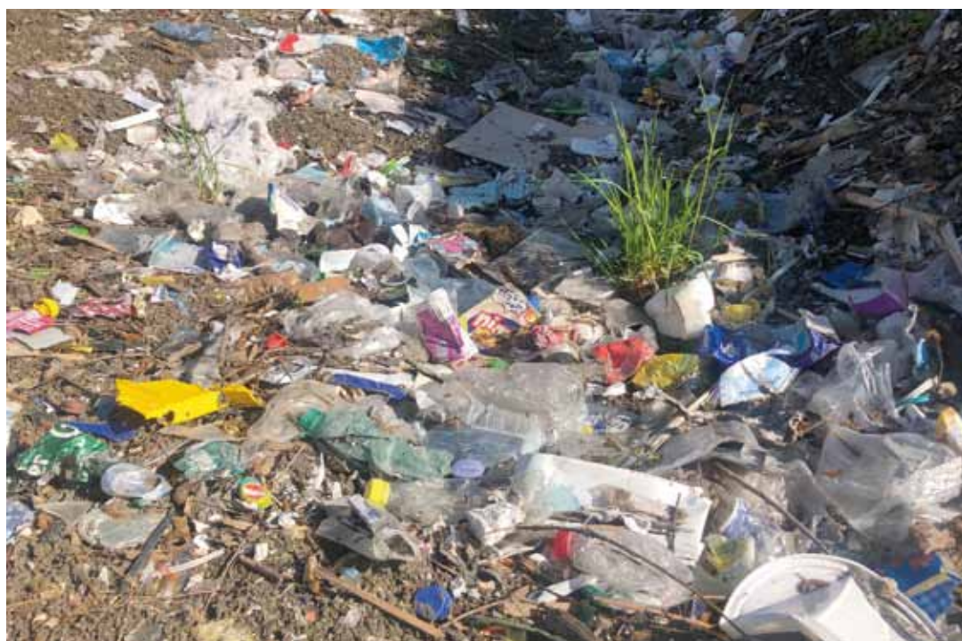
Der Begriff „Littering“ kommt aus dem Englischen und heißt nichts anderes als Vermüllen durch das ungezielte Wegwerfen von Abfällen an öffentlichen Plätzen und in der Natur. Vom Zigarettenstummel bis zur kaputten Waschmaschine, alles wird einfach irgendwo im Wald oder neben der Straße „entsorgt“. Und dann sieht es so aus.

Kunststoffverpackungen zerfallen aufgrund der UV-Einstrahlung der Sonne bereits nach kurzer Zeit in kleinste Teile, welche dann in den Boden oder in den Wasserpfad gelangen, ohne dass ein tatsächlicher biologischer Abbau der Materialien eintritt. Die Langzeitauswirkungen auf die biologischen Kreisläufe dieser, als Mikroplastik bezeichneten, Kunststoffpartikel sind noch keineswegs ausreichend erforscht. Fest steht allerdings, dass Mikroplastik in die Nahrungsketten, auch in jene des Menschen, gelangt und dort viele negative Auswirkungen hat.