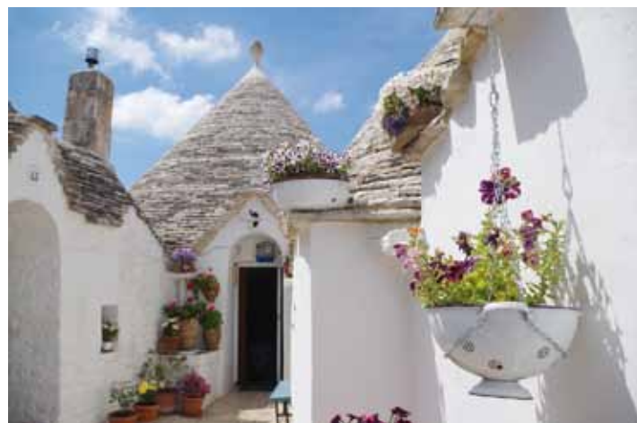
Alberobello und seine Trulli