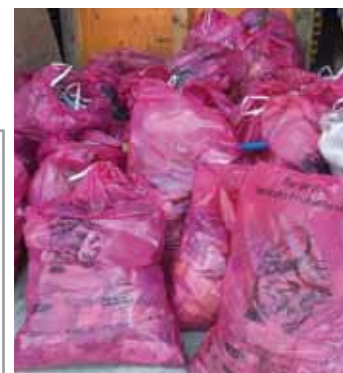
Ganz in Rosa – die Frühjahrsputz-Müllsammelsäcke

Von Schweden ausgehend hat sich eine Trendsportart etabliert, in der Joggen und Mülleinsammeln kombiniert werden. „Plogging“ nennt sich dieser Trend, der auch mit Spazierengehen und Wandern kombiniert werden kann. ■