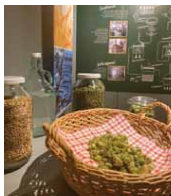
Von Hopfen und Malz bis zur abgefüllten Form. Insa Bier.