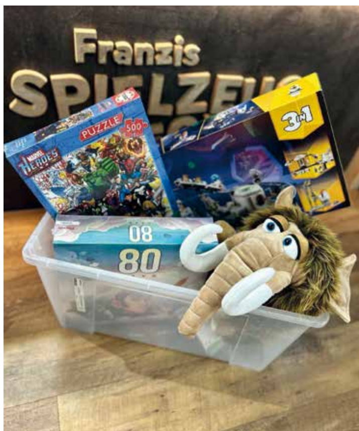
individuell befüllbare Geschenkekiste